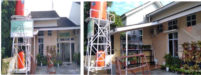
Gambar 1. Lokasi Penelitian